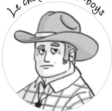
Le chef des cow-boys