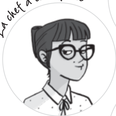
La chef d'entreprise