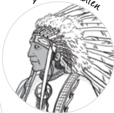
Le chef indien