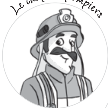
Le chef des pompiers