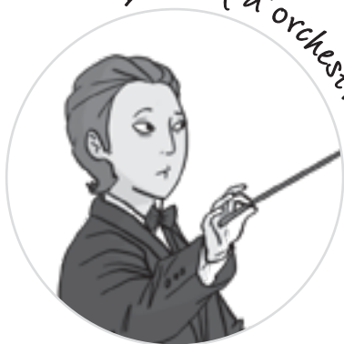
La chef d'orchestre