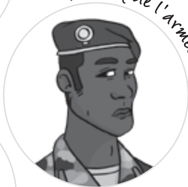
Le chef de l'armée