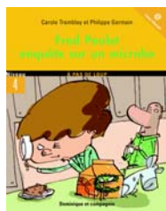
Fred Poulet enquête sur un microbe ISBN: 2-89512-345-4

Des circuits d'activités liés aux albums illustrés de la collection À pas de loup sont offerts gratuitement sur notre site Internet au : www.dominiqueetcompagnie.com/pedagogie