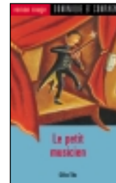
Le petit musicien ISBN : 2-89512-167-2 N° de produit : 14-12114

Sélection de la Livromagie de Communication-Jeunesse 2001-2002