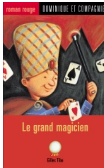
Le grand magicien ISBN : 2-89512-271-7 N° de produit : 14-13566

Dominique et compagnie / Éditeur jeunesse 300, rue Arran, Saint-Lambert (Québec) Canada J4R 1K5 Téléphone Montréal et ses environs : (514) 875-0327 poste 242 • Sans frais : 1 888 228-1498 Télécopieur : (450) 672-5448 • Sans frais : 1 888 782-1481 Courriel : dominiqueetcie@editionsheritage.com